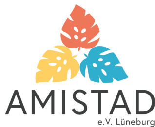
AMISTAD e.V. -Lüneburg-