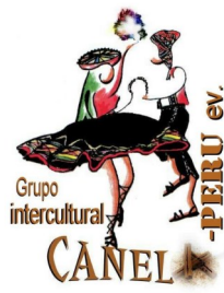
Grupo Intercultural Canela-Peru e.V. -Hannover-