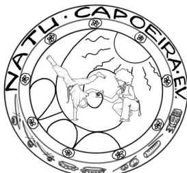
Natu.Capoeira e.V. -Hannover-