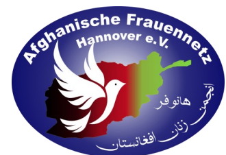
Afghanische Frauennetz Hannover e.V. -Hannover-