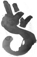
Linden Legendz e.V. -Hannover-

WIBKO Wendland-Institut für berufliche Bildung und Kommunikation e.V.