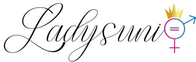
Afrikanische Fraueninitiative in Deutschland „ladysuni“ e.V. -Hannover-