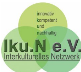
Interkulturelles Netzwerk – Iku.N e.V. -Hannover-