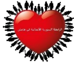
Syrisch-Deutscher Verein Hameln-Pyrmont e.V.