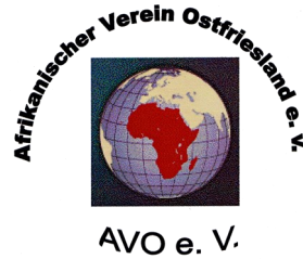
Afrikanischer Verein Ostfriesland e.V. -Leer-