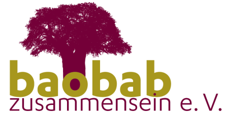
Baobab – zusammensein e.V. -Hannover-