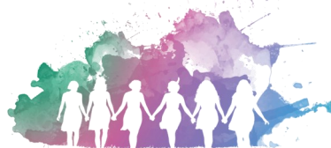
aquarela FRAUENGRUPPE e.V.