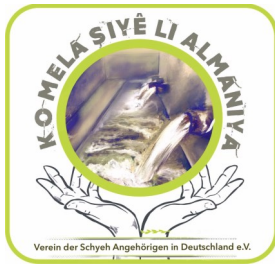
Verein der Schyeh Angehörigen in Deutschland e.V. -Hannover-